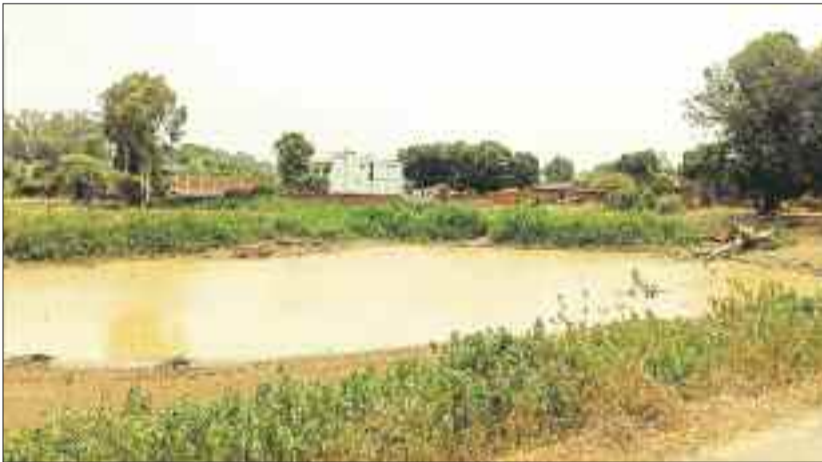
कोड़या सागर बांध के आसपास हो रहा अतिक्रमण।