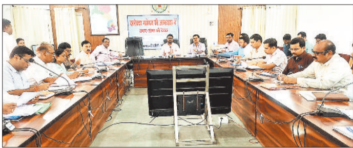
अधिकारियों की बैठक लेते कलेक्टर।

उन्होंने बारिश के मौसम में फैलने वाली मौसमी बीमारियों को रोकने स्वास्थ्य के लिए विभाग को सतर्क रहने के निर्देश देते हुए आवश्यक कदम उठाने के लिए निर्देश दिए। कलेक्टर ने लोक स्वास्थ्य यांत्रिकी विभाग के ईई को संपादित किए जाने और पेयजल की सैंपल लेकर जांच करने के निर्देश दिए। उन्होंने समस्त नगर निकायों में पेयजल के लिए कार्ययोजना बनाकर जानकारी प्रस्तुत करने के निर्देश दिए। कलेक्टर सभाकक्ष में आयोजित समय-सीमा की बैठक में कलेक्टर ने भवन निर्माण स्कूलों, आंगनवाड़ी केन्द्रों की जानकारी एकत्र कर भवन निर्माण प्रस्ताव