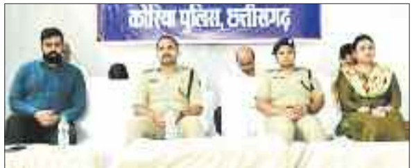
कार्यशाला के दौरान उपस्थित अतिथि।

कानूनों के माध्यम से नागरिकों के अधिकारों की रक्षा और अपराधों की रोकथाम में महत्वपूर्ण सुधार किए गए हैं। आज के डिजिटल युग में साइबर अपराध, डेटा सुरक्षा और तकनीकी धोखाधड़ी जैसे नए प्रकार के अपराध सामने आ रहे हैं। भारतीय न्याय संहिता 2023, भारतीय नागरिक सुरक्षा संहिता 2023 और भारतीय साक्ष्य अधिनियम 2023 इन नए प्रकार के अपराधों के लिए उपयुक्त कानूनी उपाय प्रस्तुत करती हैं। इनका उद्देश्य अपराधिक हो चुके कानूनों को समाप्त करने के साथ नए समय के साथ नए प्रावधान और समाधान प्रस्तुत करना भी है। नए कानूनों से