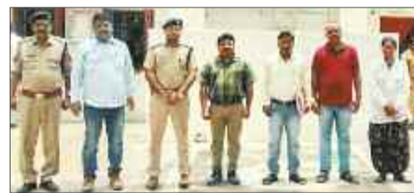
जेल का निरीक्षण करते समिति के सदस्य।

निरीक्षण के दौरान जेल में निरूद्ध बंदियों से उम्र के संबंध में पूछताछ किया गया। जिला जेल बैकुण्ठपुर में कुल बंदी 160 से उम्र के