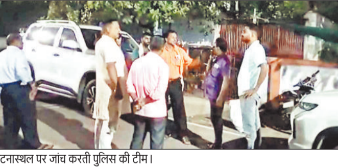
घटनास्थल पर जांच करती पुलिस की टीम।

हरिभूमि न्यूज | कोरबा एएसईसीएल के दीपका स्थित अस्पताल में पदस्थ एक डॉक्टर के सूने मकान में चोरों ने धावा बोलकर सोने चांदी के जेवरत सहित लाखों का माल पार कर दिया है। डॉक्टर की लिखित शिकायत पर पुलिस मामले की तहकीकात में जुटी हुई है।