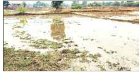
सोनहत में हुई बारिश से खेत तलाबल।

बैकुण्ठपुर जनपद पंचायत अंतर्गत ग्राम छरछा बस्ती, चेरामपारा तक बारिश का असर रहा, इसके बाद खरवत से लेकर जिला मुख्यालय बैकुण्ठपुर तक पूरी तरह से सूखे की स्थिति रही। इसके एक दिन पूर्व जिला मुख्यालय में झमाझम बारिश हुई थी। वर्तमान में कई क्षेत्रों में बारिश समय-समय पर हो रही है जो कि खंड वर्षा होने की स्थिति बनाई हुई है। शहर बैकुण्ठपुर में अब तक सामान्य से बहुत कम बारिश दर्ज की गई है। जबकि जिले के कई ग्रामीण क्षेत्रों में बीच-बीच में झमाझम बारिश कई दिन हो चुकी है, जिससे कि ग्रामीण क्षेत्रों में किसान अपने खेतों में हल चलाने शुरू कर दी है।